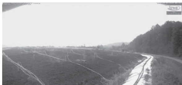
Abbildung 2 Austretende feuchte Luft oberhalb des Flächenbiofilters

Ziel des Pilotprojektes ist es, den Deponiekörper aerob zu stabilisieren und so eine Entlassung aus der Nachsorge innerhalb eines absehbaren Zeitraumes zu erreichen. Mithilfe des geplanten Verfahrens sollen die organischen Bestandteile im Deponiekörper beschleunigt um- und abgebaut werden. Dadurch können Setzungen vorweggenommen und schädliche Deponiegasemissionen größtenteils reduziert werden. Auch ist damit zu rechnen, dass sich die Qualität des Sickerwassers bedeutend verbessert. Parallel dazu können im Rahmen der wissenschaftlichen Begleitung des Pilotprojekts